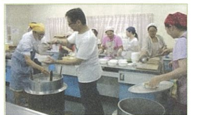
うどん、調理しています