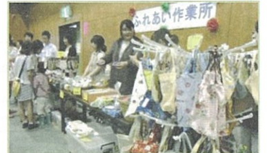
作業所の販売コーナー