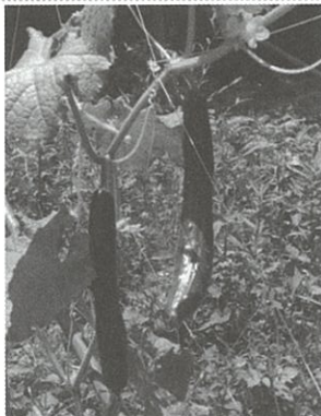
虫と雑草の戦いです。