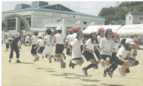
調子をあわせて 大縄跳び