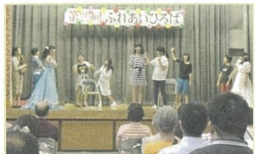
ステージ、演劇の様子