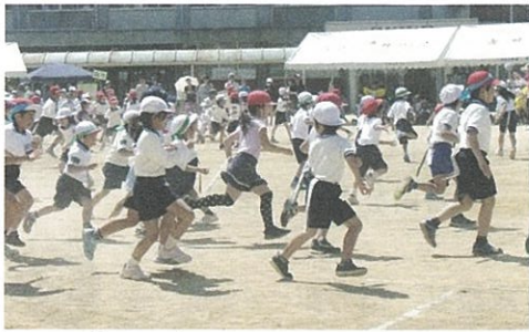
しっぽとりゲーム 1年生が2、3年生の腰につけた尻尾を追いかける。

当日は、お天気にも恵まれ、子ども会会員・保護者・来賓をあわせ300名以上の参加者が心地よい汗を流しました。