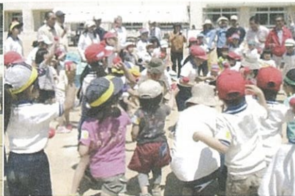
来賓と一緒に玉入れ