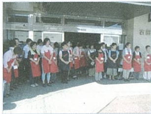
スタッフ一同お待ちしております