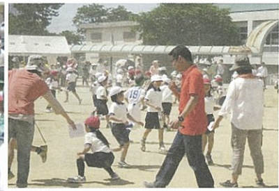
保護者も競技の運営に加わって