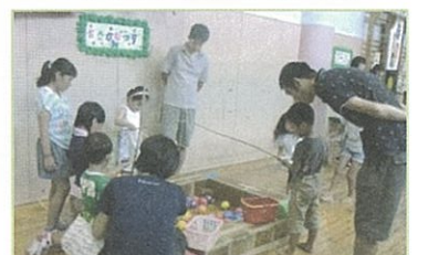
児童館・遊びランド

『ふれあいひろば』は地域の人達との出会い、協力、ふれあい、多世代の交流などを目的に行われます。 バザーでは、皆さまにご提供を戴いた遊休品を公民館ホールで販売します。 ステージでは、古田小学校、中学校、広島学院、古田児童館の児童・生徒達が出演の予定です。三つの作業所の人達の出演もあります。 遊びランドでは、児童館の先生たちが子ども達の楽しめる遊びを企画しています。 レストコーナーでは、ほっと一息ついてください。